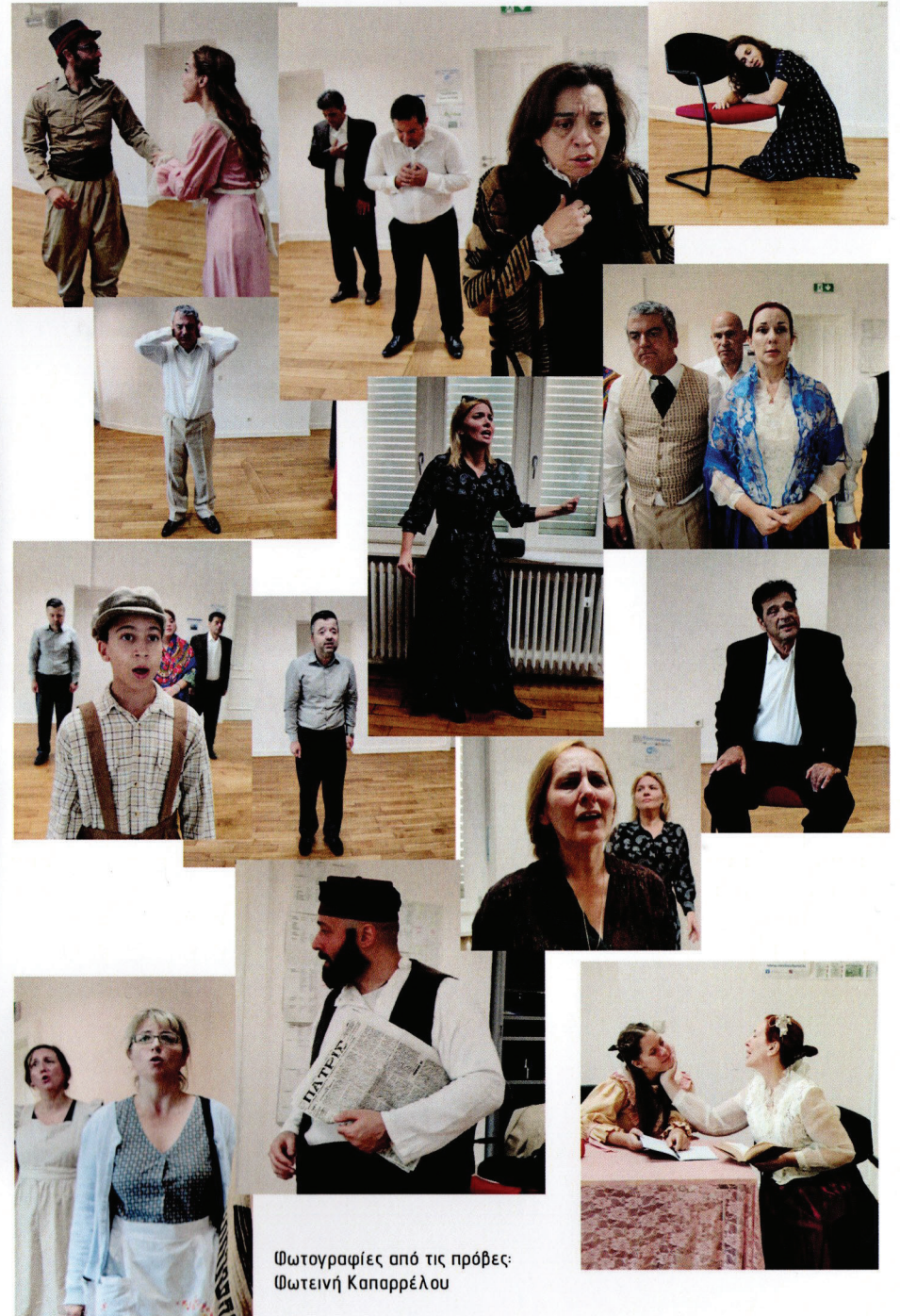
Φωτογραφίες από τις πρόβες: Φωτεινή Καπαρέλου